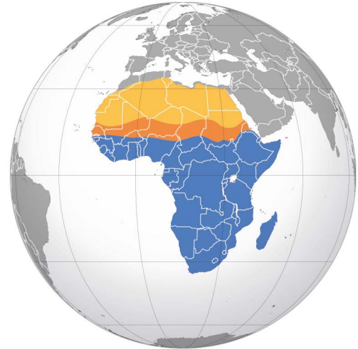
Географічна карта Африки на південь від Сахари

Африка залишається континентом з найнижчими показниками дотримання прав людини та доступу до основних медичних послуг, води та їжі. У 2022 році Африка стане домом для 1,4 мільярда людей, що становить приблизно 17% світової популяції і тренди показують, що населення континенту продовжуватиме значно зростати.