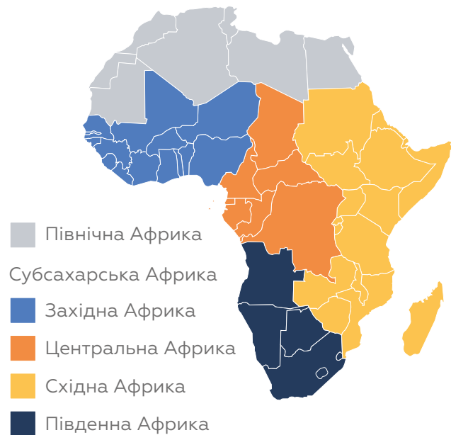
П'ять регіонів відповідно до поділу, затвердженого Африканським Союзом

Як уже зазначалося, Африка має різні історико-географічні регіони, які також служать основою для районувань, регіональних політичних та економічних об'єднань. Наприклад, до регіону Магриб традиційно включають Західну Сахару,